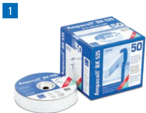
Ampacoll® BK 535: Butylkautschukband