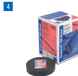
Ampacoll® ND.Band: Nageldichtband