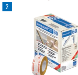
Ampacoll® XT 60: Acrylklebeband